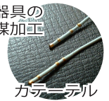
医療器具の 光触媒加工 カテーテル